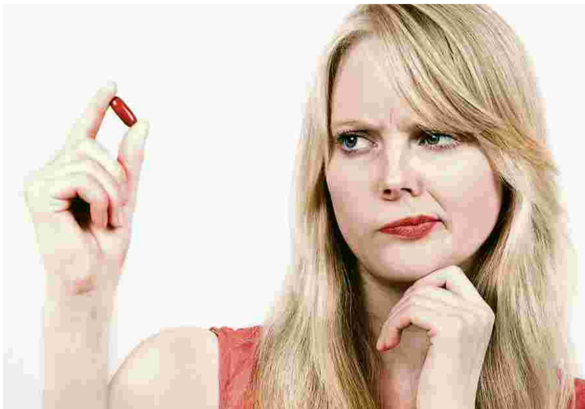
Passt dieses Medikament für mich oder nicht? Ein Gentest bringt Gewissheit.

Für den Gentest wird eine Mundschleimhaut-Probe entnommen, 35 Gene sind arzneimittelwirksam. Die Auswertung dauert zehn